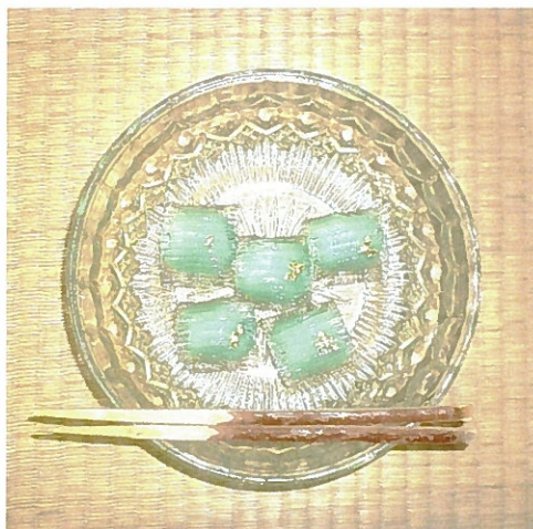
お菓子のご銘は「すだれ」

座談会では、この「仏教女性の集い」でご指導頂いている南先生から逆に私たちに質問がありました。その問いは、「若い方に聞きたいのですが、生かされていると思った事がありますか？生かされているという意味をどう感じていますか？」参加者のほとんどが50代以上の中に、若い方がいらしていたのでその方に向けての問い掛けでした。「生かされていると言う感覚はなく、生きて いのち いる生命であって、ここでお話を聞くまでは思いもしなかった…」と、答えられた言葉に南先生は、年を重ねて行くと生かされているんだ～と、言う実感が分かります。今はまだ意味が分からないでしょうが、生かされていると言う事、学んでほしいと言われていました。