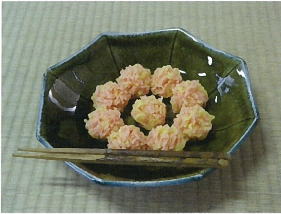
今日のお菓子「紅葉 もみじ きんとん」