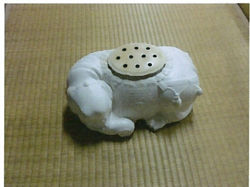
《香象 身を清めて道場へ》