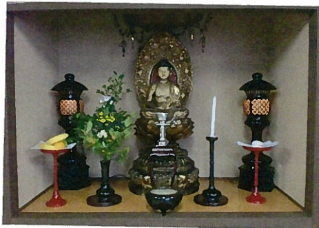
《阿弥陀如来 ご本尊様》